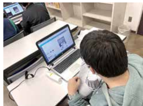
案外スムーズにできた、T所員