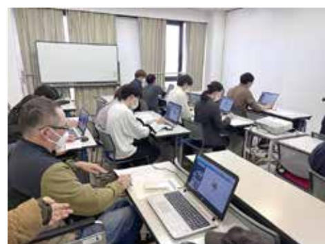
真剣な面持ちのM所員

続いては電話対応の仕方等を教わりました。作業所では私の席の傍に電話がある為に、電話対応はとても大事です。それで当日に教わった事は、笑顔と感謝だと教わりました。今後感謝の気持ちを持って人と接するようになればいけないと思いました。