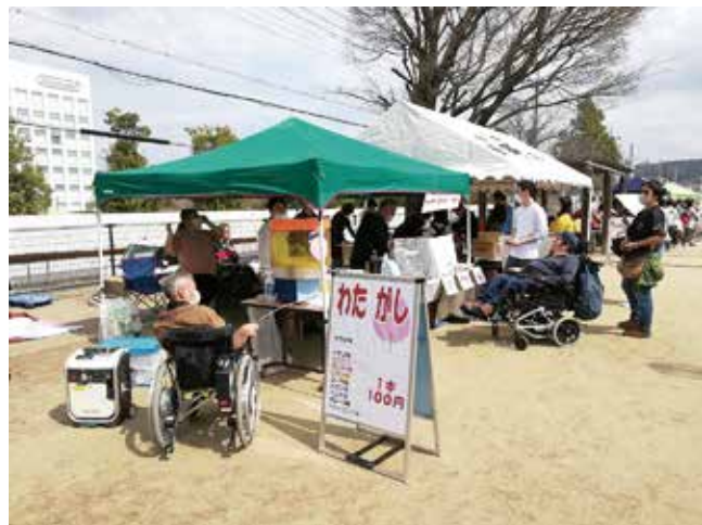
この日を待ってたんです!

そして、休みの中会場まで駆けつけてくださった皆さん、本当にありがとうございました。