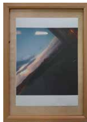
タイトル「夏の夕日」