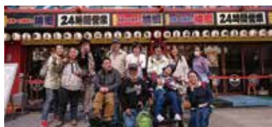
ワークス研修旅行/大阪天王寺