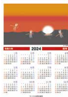
「京都の黄昏赤とんぼの風景カレンダー」 イラスト / 椿森信幸