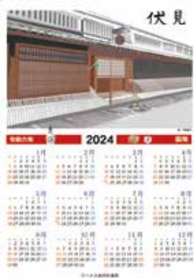
「伏見〜京の酒蔵〜カレンダー」 イラスト / 門野純平