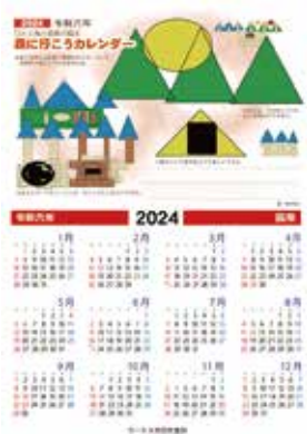
「森に行こうカレンダー」 イラスト / 鈴木翔太