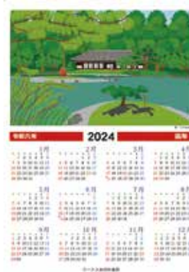
「京都の風景カレンダー」 イラスト / えぎ田大輔