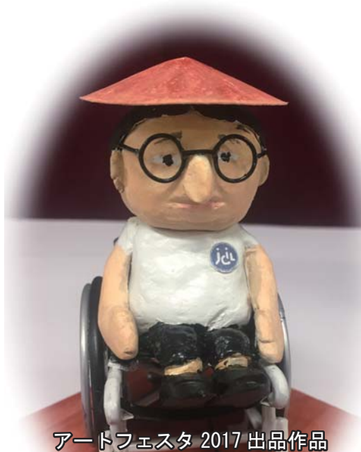
アートフェスタ 2017 出品作品

障害のある人やその周りの人、地域や施設で生活している 皆さんが創る芸術、工芸の作品展です。